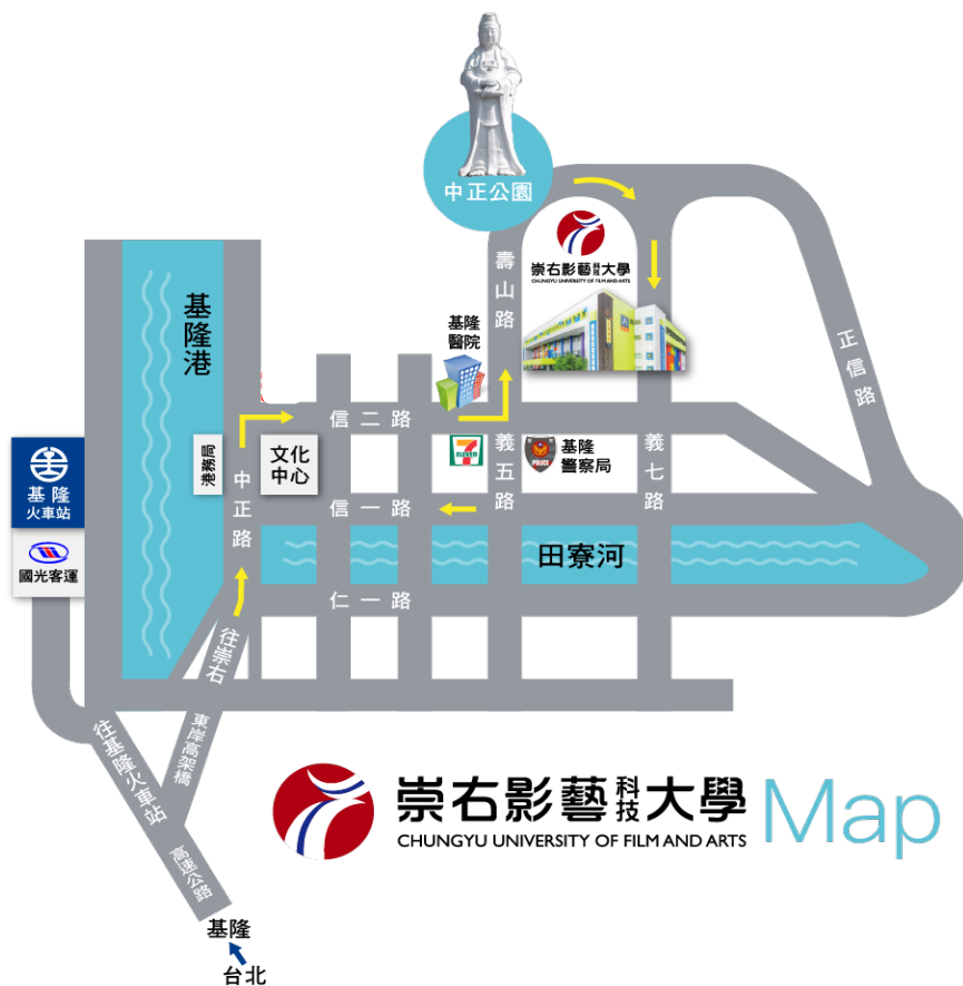
附件 8：崇右影藝科技大學位置圖